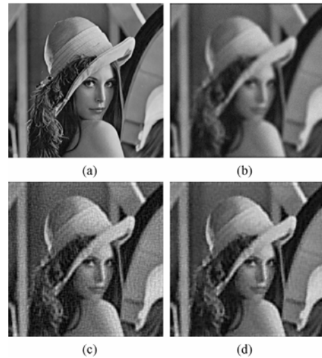
图1 Lena 降质图像复原结果的比较

实验表明, 本文方法对两幅图像的复原结果其 \Delta_{\text{SNR}} 都要高于 Kang 方法的复原结果, 同时从人眼视觉的判断上