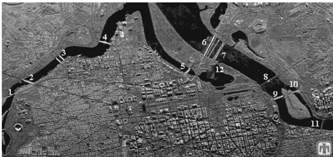
图 3 Washington D.C 的 SAR 图像图

法后, 比 SVM 方法训练时间、识别时间都缩短了很多; 其次, 对 SAR 图像将 ICCA 算法得到的聚类中心用作协同神经网络的训练样本的原型向量, 与将每一类训练样本的原图能量特征直接作为原型向量相比, 该方法能提高网络的识别性能。