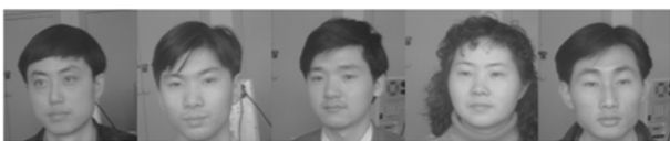
图 1 NUST603 人脸图像库中的一些人脸图像

本文所提方法在 NUST603 人脸图像库中进行了实验。该人脸图像库一共包括 96 个人的 960 幅图像, 其中每个人都有 10 幅不同的人脸图像, 摄入人脸图像的设备为一台黑白摄像机, 每幅人脸图像都为 256 \times 256 大小的灰度图像, 每个像素的灰度值采用 8bit 表示, 拍摄人脸图像时的背景较为复杂, 拍摄时的光照既有自然光, 也有室内的白炽灯光。每张人脸可以在上下、左右大约 15^\circ 的范围内倾斜, 图 1 列出的是 NUST603 人脸图像库中的一些人脸图像。