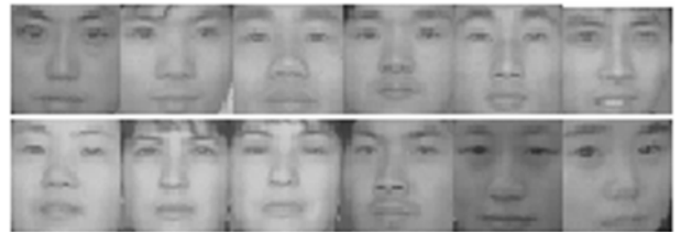
图 2 标准化以后的一些人脸图像

由于拍摄到的人脸图像中除了人脸面部区域外, 还存在着人脸周围的背景, 这些周围背景会对识别性能造成一定的影响。为了便于进行识别, 首先要将拍摄到的人脸图像进行必要的剪切和标准化预处理。首先根据人眼的灰度以及脸部的直观知识将可能的眼部区域进行定位, 然后根据模板匹配方法和相关系数方法通过预先设定的阈值进行人眼的精确定位和脸部图像的自动校准, 使得校准图像中的人脸对位置平移变化、尺度放缩变化和姿态角度变化具有一定的稳定性, 标准化后的人脸图像为 32 \times 32 大小的灰度图像, 每个像素的灰度值仍采用 8bit 表示。通过对所拍摄图像的剪切和标准化预处理, 可以在一定程度上消除周围背景因素和人脸的几何变化因素对识别造成的影响, 同时还一定程度上降低了后续处理的计算复杂度。图 2 列出的是标准化以后的一些人脸图像。